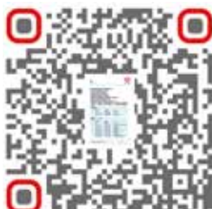
Informazioni sull'assistenza tecnica