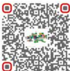
Consulente sui sigillanti